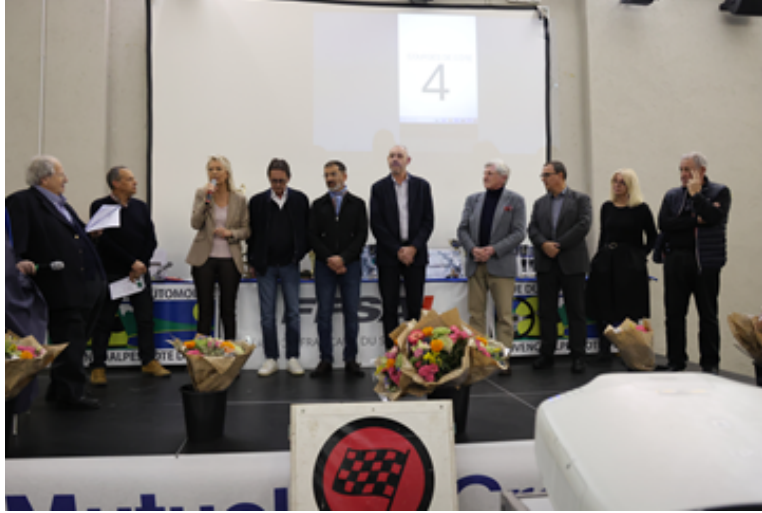
Les Elus de la Ville d'Antibes et nos Partenaires