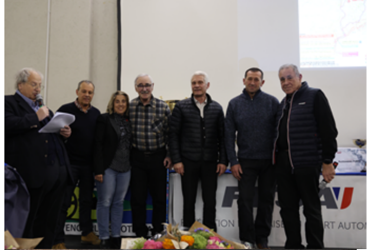
Les Elus des Mairies traversées